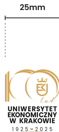
modyfikacja (brak daty w tarczy)